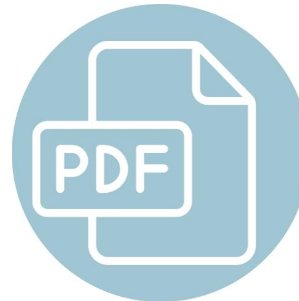
Regras para determinação do Nº de questionários