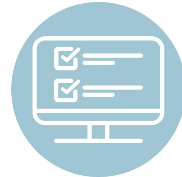
Estrutura do Questionário